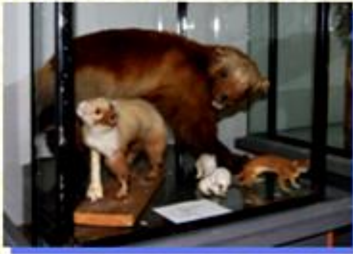
Птицы и звери наших лесов