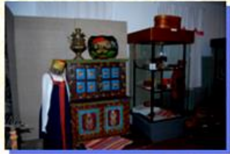
Быт и занятия пинежских крестьян до 1917 года